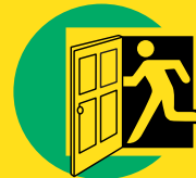
1 Ga direct naar binnen