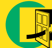
2 Sluit deuren en ramen