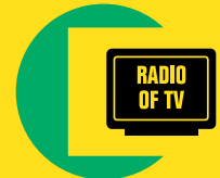
3 Zet radio of tv aan

Elke eerste maandag van de maand om 12.00 uur worden de sirenes getest